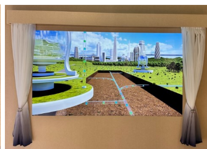
ウィンドウゾーン