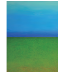
田村久美子 『yourscape “beyond the blue”』 oil on canvas, 110×85×4cm

エア・ウォーターは創業以来、空気や水などのさまざまな地球の恵みを、人々の暮らしや産業にとって「なくてはならないもの」へと進化させて、社会に安定的に提供してきました。これからも豊かな自然とともに、未来の社会にとって必要となる新たな価値を創造し続けていきます。この想いを表紙から感じていただければ幸いです。