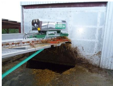
原料自動投入装置・前処理設備