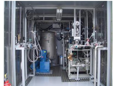
バイオガス精製装置