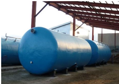
乾式メタン発酵槽