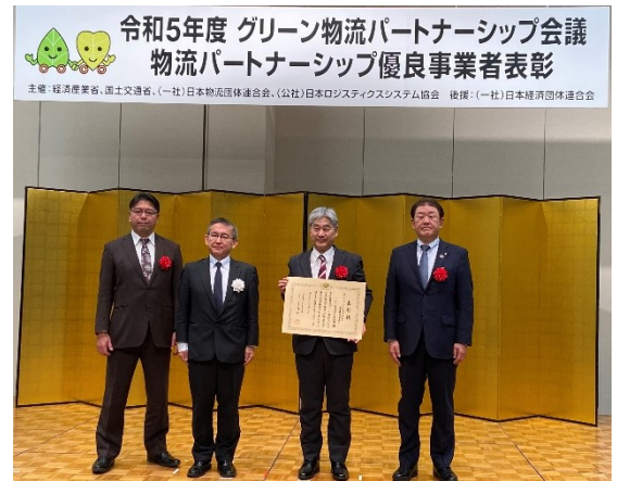
2023年12月18日に行われた表彰式の様子

経済産業省および国土交通省などが物流分野における環境負荷の低減、物流の生産性向上等持続可能な物流体系の構築に向けた荷主企業・物流事業者が連携した取り組みを普及促進するため、平成18年(2006年)度より特に顕著な功績があった事業者に対して表彰を行っています。このたびエア・ウォーター物流が受賞した「物流構造改革表彰」は、「労働力不足対策の推進と物流構造改革の推進」に即した部門賞となります。