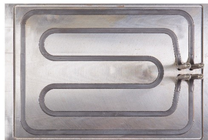
半導体装置向けヒータ