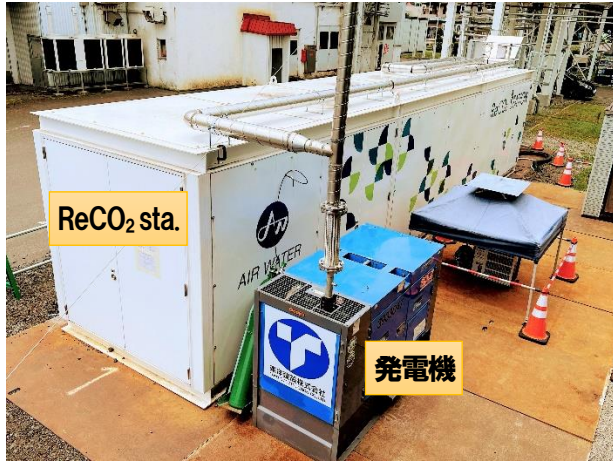
CO 2 回収実験装置 (ReCO2 STATION と発電機)