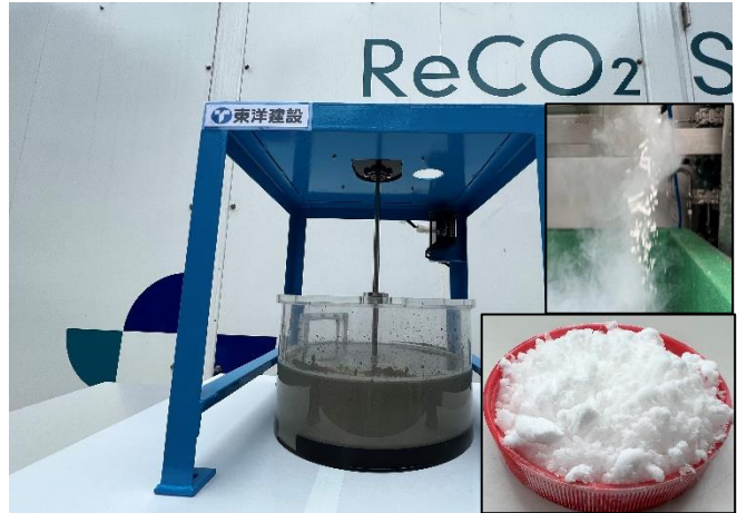
回収したCO 2 (ドライアイス)をセメントスラリーに固定