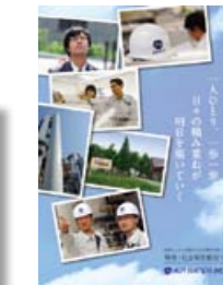
環境・社会報告書