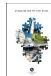
アニュアルレポート