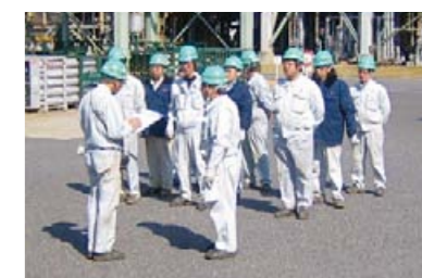
地震・津波対応訓練

日本ファインガスは定期的な緊急対応訓練も含め、地道な活動を通して、今後もリスクの低減に取り組んでいきます。