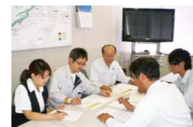
リスクアセスメント活動

の危険性または有害性を見つけ、そのリスクの程度を定量的に表す)を実施することで、その重要性を検討し対策を決定、実行します。リスクを全員で共有し、事故や災害を未然に防止できるリスクアセスメントの活動は大変意義があり、有効なものとなっています。