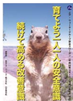
安全スローガンポスター

毎年「全国安全週間」にあたり、安全意識の高揚を図るため、グループ会社も含めた全従業員に呼びかけ「安全スローガン」を募集しています。2010年度はエア・ウォーターグループ53社から2,875件の応募がありました。応募数は年々増加傾向にあり、これに応募することにより、職場や家庭で安全について考える良い機会になっていると考えられます。最優秀作品は表彰すると共にポスターにして各職場に掲示しています。