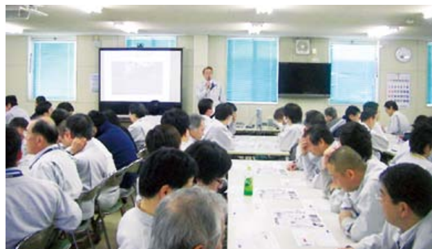
堺事業所における地震防災訓練

その中の一つ、堺事業所では、地震・津波の発生メカニズムや避難計画などを学び、地震発生時の初期行動について各自で整理した後、グループに分かれ、各人の行動について意見交換を行うなど、地震・津波発生初期時におけるシミュレーション訓練を実施しました。