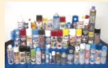
エアゾール商品群

当社のエアゾール事業は、平成元年に近畿エアゾール工業㈱、平成13年に柏化学㈱ならびに東京エアゾール化学㈱の経営権を取得し、グループ全体で業界シェア3位を確保しました。平成15年10月には、これら3社を合併し、「エア・ウォーター・ゾル㈱」(本社:東京都、資本金:400百万円)をスタートさせるとともに、茨城、岐阜、兵庫の全国3工場体制を構築しました。また、本年3月には商品開発力に定評のある業界4位のキョーワ工業㈱に出資し、さらなる事業の拡大を図りました。