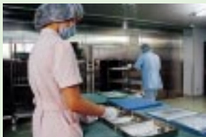
受託滅菌センター

ビスにおいても介護ショップや在宅支援センターの設置などの新たな展開を行っております。