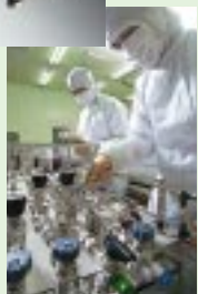
半導体製造用ガス供給装置