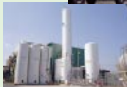
酸素・窒素ガス併産装置「V3」