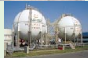
ハローガス球形タンク