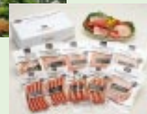
「はやきたクラシック」