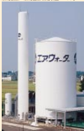
液化酸素・液化窒素製造装置「VSU」

当社の独自技術により開発したこのプラントは、フロン冷凍機を使わない環境負荷低減型であるとともに、2タービン方式による冷却方法と最新の特殊真空断熱技術を採用したことから、高効率・低コスト・省スペースを特長としています。また、設備ユニットのパッケージ化による工期の大幅な短縮や運転制御システムの全自動化による人的コストの省力化を実現しています。